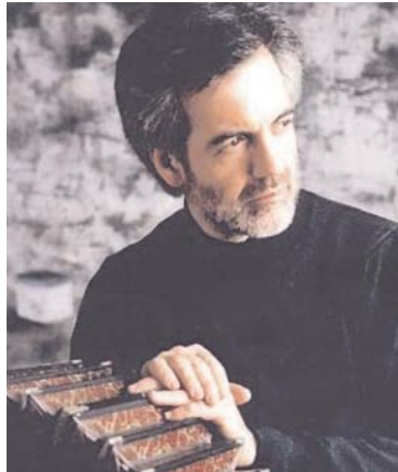
el corazón del Uruguay. Desde 1980 vive con su familia en Italia, en Macerata, su ciudad adoptiva. "Yo llegué a Italia, -nos cuenta el maestro